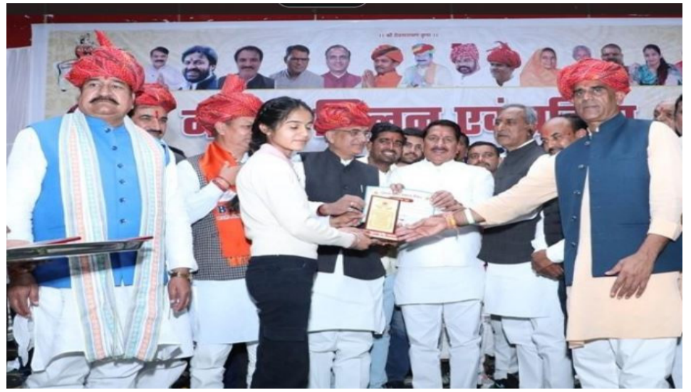
गुर्जर समाज की प्रतिभाओं का सम्मान करते अतिथि।